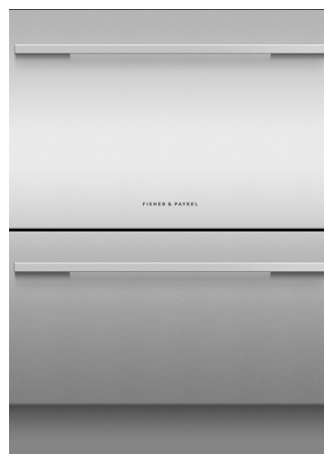
In optie: DD60DT-KIT EZKleen RVS deurpanelenset